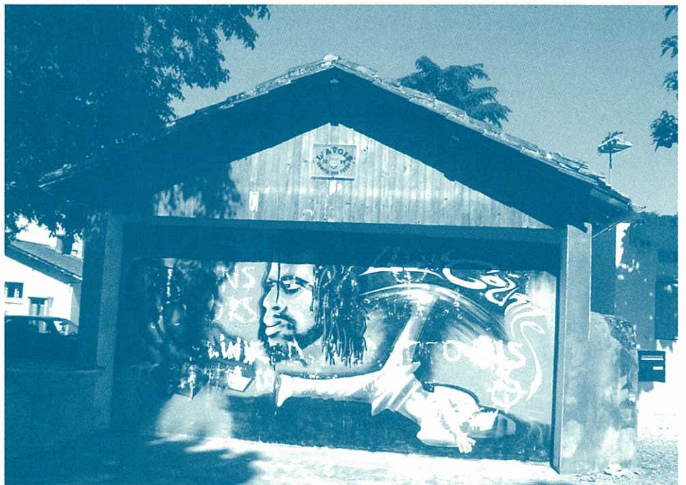
Ancien lavoir : le Tourne.

d'initiatives menées à bien par le C.L.C.V.