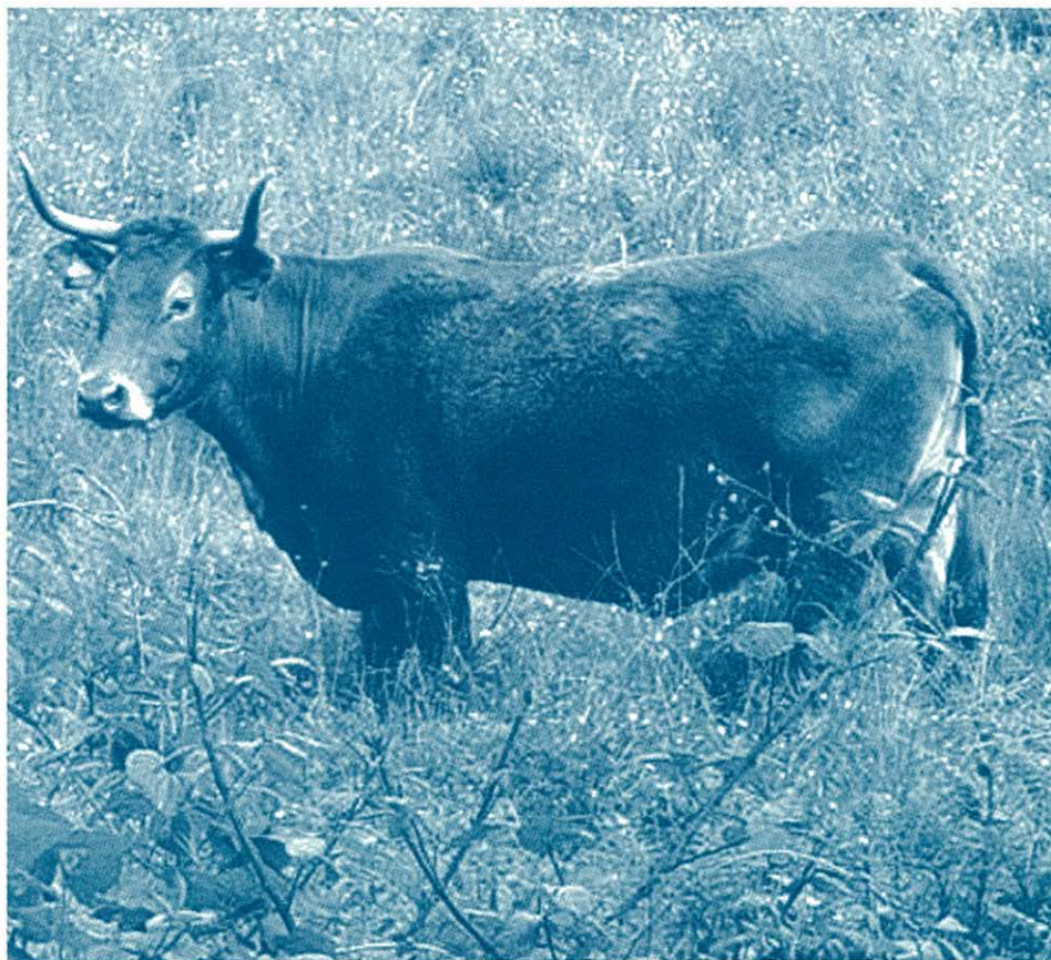
Une vache en prairie humide.