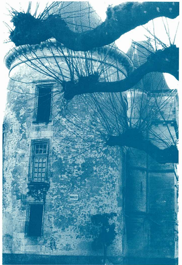
Thouars (paroisse Saint-Genès de Talence).